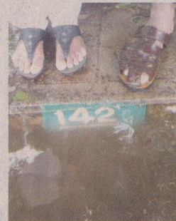
അണക്കെട്ടിന്റെ സ്പിൽവേയ്ക്കു സമീപമുള്ള നടപ്പാതയുടെ പടവുകളിൽ 142 അടിയിൽ വെള്ളം എത്തിയതിന്റെ ചിത്രം.

തോണിയുടെ പരിസരത്തു നിന്നു മാറ്റി സമീപത്തെ ലോഡ്ജുകളിൽനിന്നു പോലും ആളുകളെ ഒഴിപ്പിക്കേണ്ടി വന്നു.