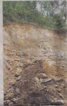
കരിഞ്ചോലമലയിൽ ജലസംഭരണിക്കായി കുഴിയൊരുക്കിയ പ്രദേശം ഉരുൾപൊട്ടലിനുശേഷം