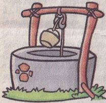
പാനീയ ശ്രദ്ധ വേണം

ചിഞ്ഞഴുകിയ സസ്യങ്ങൾ, കേടുവന്ന ഭക്ഷ്യവസ്തുക്കൾ എന്നിവ ഉടൻ നീക്കണം. സ്ഥലമുള്ളവർ നാലടി ആഴത്തിൽ കുഴിയെടുത്ത് മുകളിൽ ബ്ലീച്ചിങ് ലായനി ഒഴിച്ച് മണ്ണിട്ട് മൂടണം. കിണറുകൾക്കടുത്ത് കുഴിച്ചിടരുത്. പ്ലാസ്റ്റിക് കവരുകുളിവിട്ട് സംസ്കരിക്കരുത്.