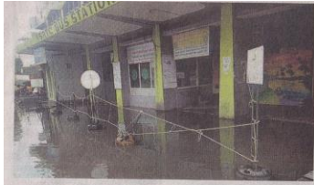
എറണാകുളം, കെ.എസ്.ആർ.ടി.സി. ബസ് സ്റ്റാൻഡിൽ വെള്ളം കയറിയപ്പോൾ.