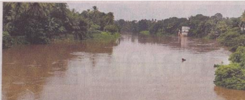
കനത്ത മഴയിൽ മൂവാറ്റുപുഴയാർ ചെല്ലി നിറഞ്ഞൊഴുകുന്നു.