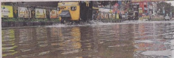
കനത്ത മഴയെത്തുടർന്ന് എറണാകുളം എം.ഐ. റോഡിലുണ്ടായ വെള്ളക്കെട്ട്.

ഇന്നലെ രാവിലെ പത്തരയ്ക്കിടെയായിരുന്ന അപകടം ഫയർഫോഴ്സും സ്പെഷൽ ടീമുമാണ് തിരച്ചിലും നവോദയ ജംക്ഷനു സമീപം റോഡിലേക്കു മരം വീണു ഗതാഗതം മുടങ്ങി. മറ്റുവിവിധ ഭാഗങ്ങളിലും സഹായം