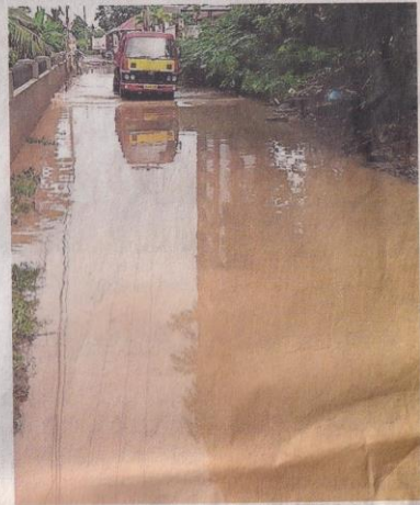
കാക്കനാട് പാലപ്പുളി പാലപ്പുളി സഗർ-വാഴക്കാല റോഡ് വെള്ളത്തിലായതിലേറിയിട്ട്.

വീണു. കാക്കനാട്ടു പല റോഡുകളിലും വെള്ളക്കെട്ടും രൂപമെടുത്തു. പടവുകൾ ഇനിയും ജംക്ഷൻ പാലപ്പുളി സഗർ-വാഴക്കാല റോഡ് പൂർണ്ണമായും വെള്ളത്തിലായി. കാനകളിലൂടെ വെള്ളം ഒഴുക്കി പോകാൻ ഇടവില്ലാതെ തിരച്ചിൽ കഴിഞ്ഞാണ് റോഡിൽ വെള്ളക്കെട്ടുന്നത്.