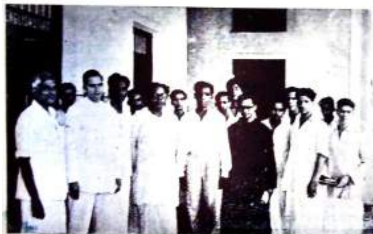
Mr. M. M. Shah, Union Minister for Industries.

Mrs. Durgabhai Deshmuk, the Chairman of Central Social Welfare Board.