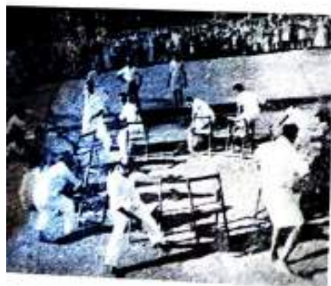
Musical Chair—Staff members.