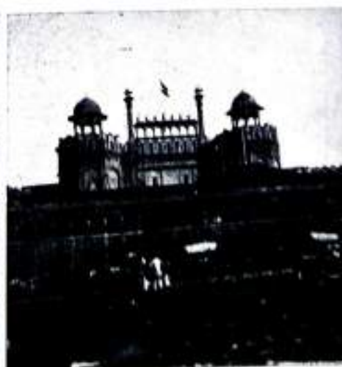
Red Fort— New Delhi