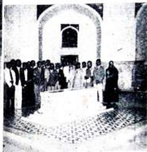
Mausoleum of Humayun.