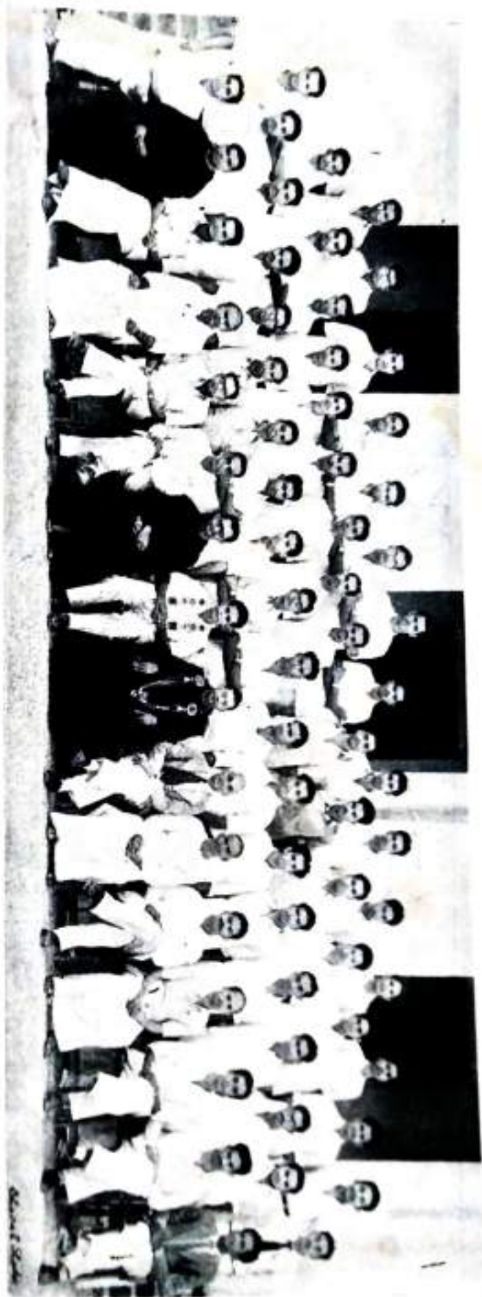
Out-going B. A. Economics Students.