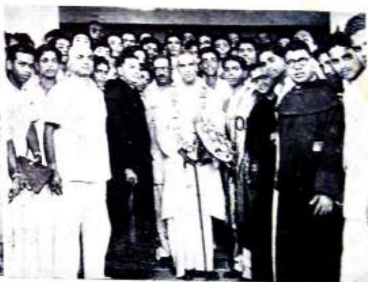
Mr. V. K. Krishna Menon, Defence Minister.