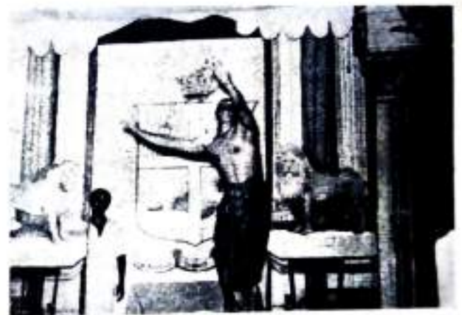
വാരാളം—By K. Radhakrishnan IV U C.