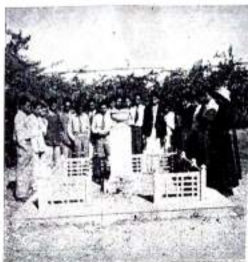
Here fell lifeless Bapuji.