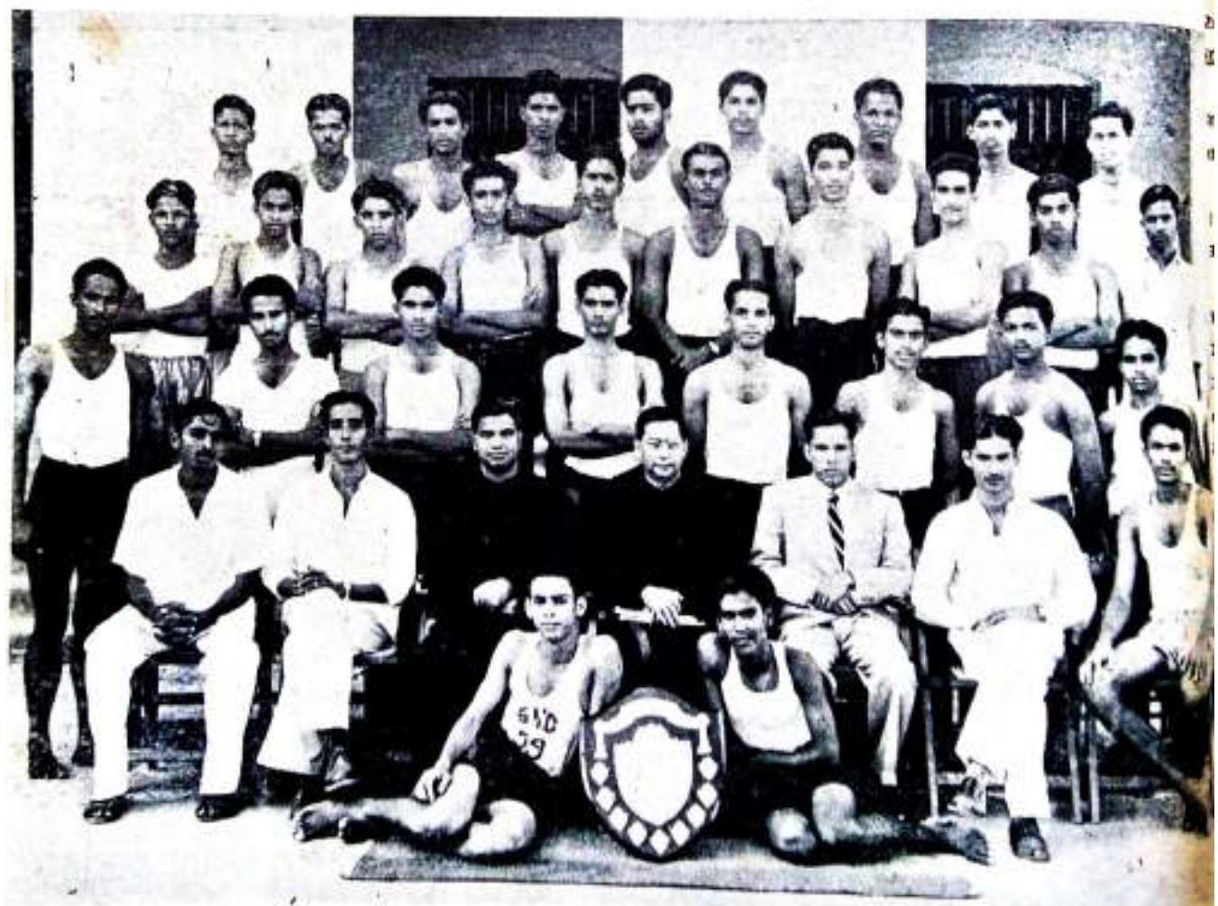
Intramural Champions (Green & Yellow Houses)