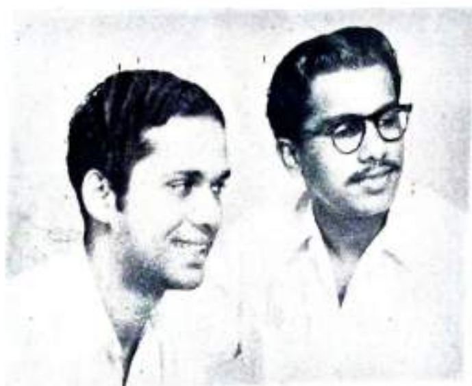
V. T. George III U.C.