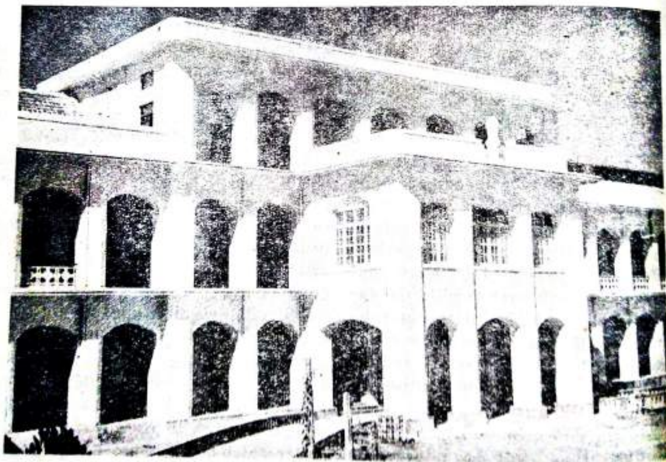
COLLEGE PORTICO — A LONG CHERISHED PLAN NEARING COMPLETION.