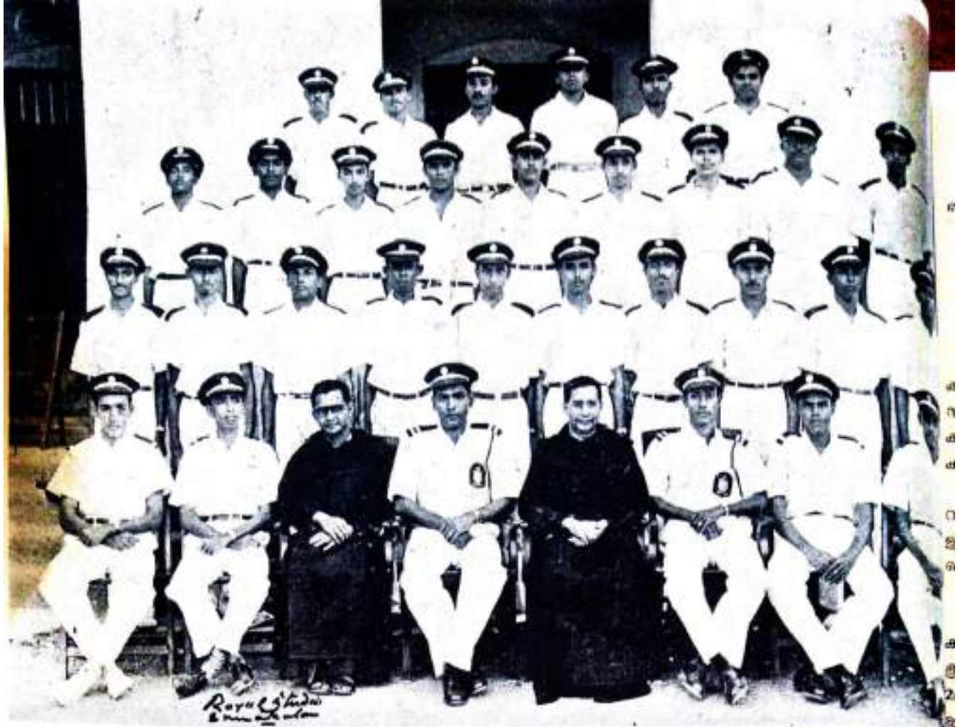
College Volunteer Corps.