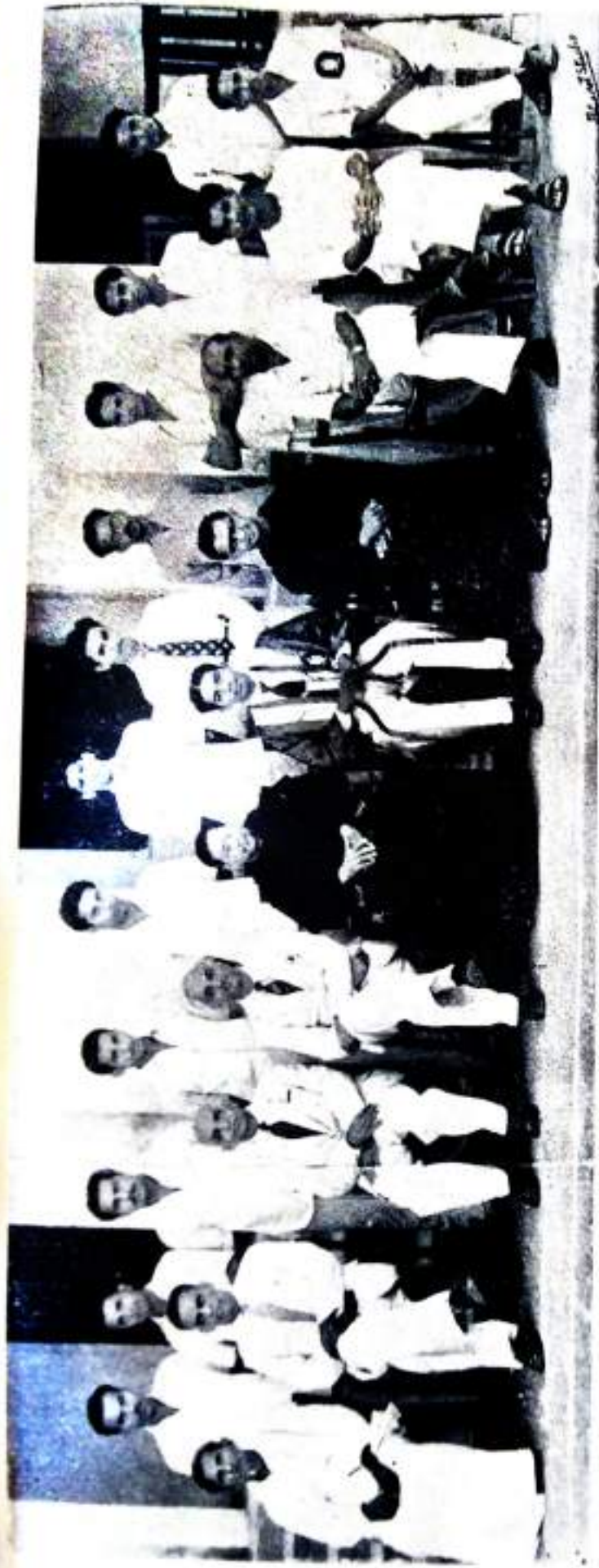
COLLEGE UNION COMMITTEE