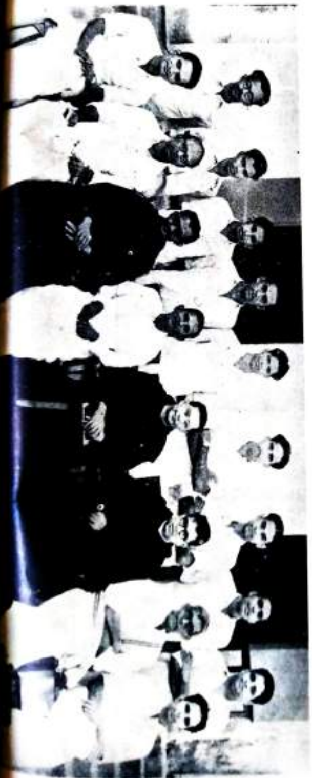
Out-going Malayalam B. A. Students— First Batch.