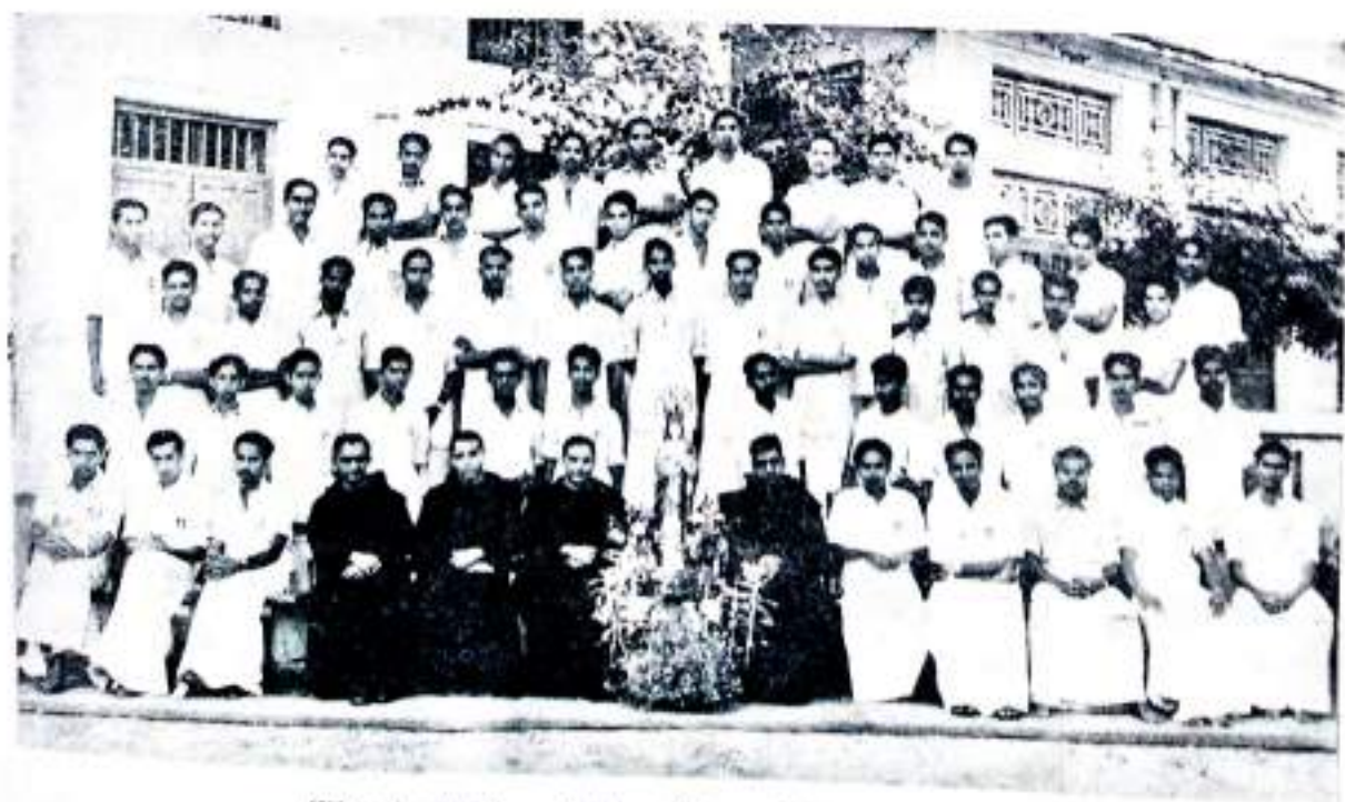
The Sodality of the Blessed Virgin Mary.