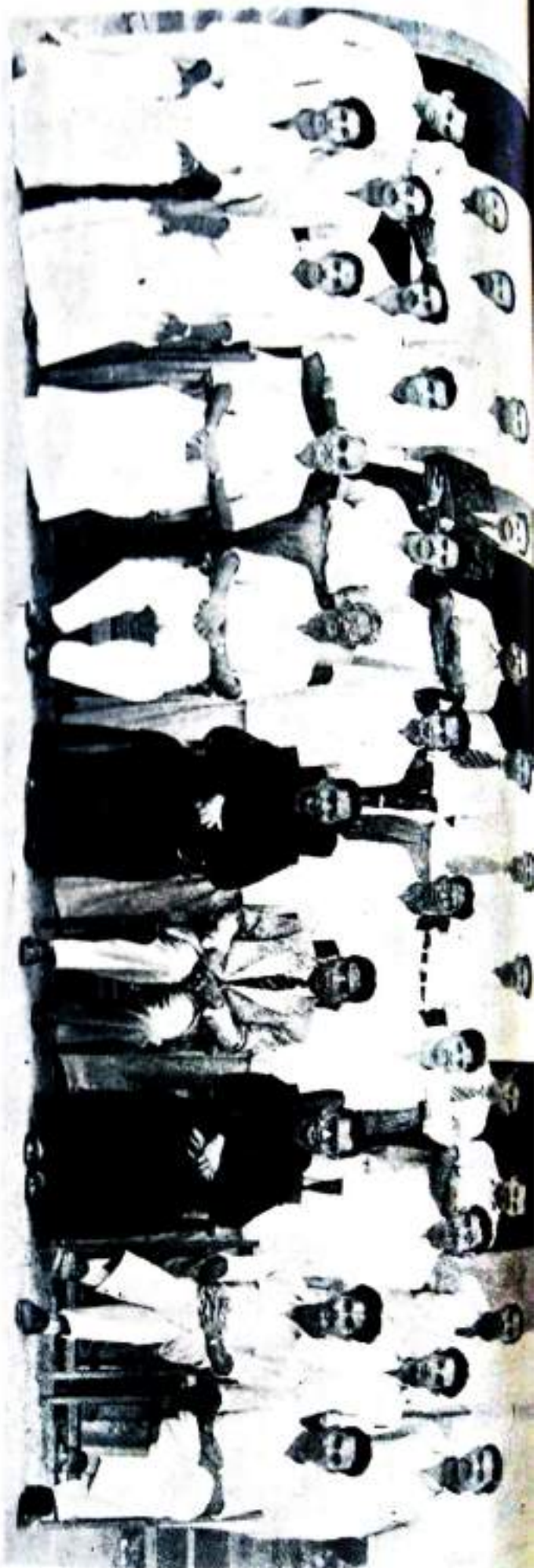
Out-going D. S. S. Students.