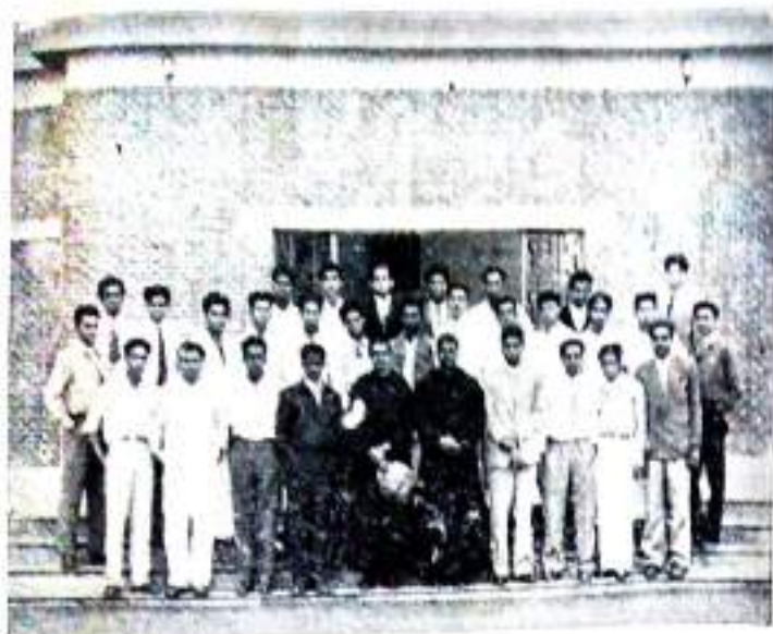
The Party at St. Columbus High School, New Delhi.