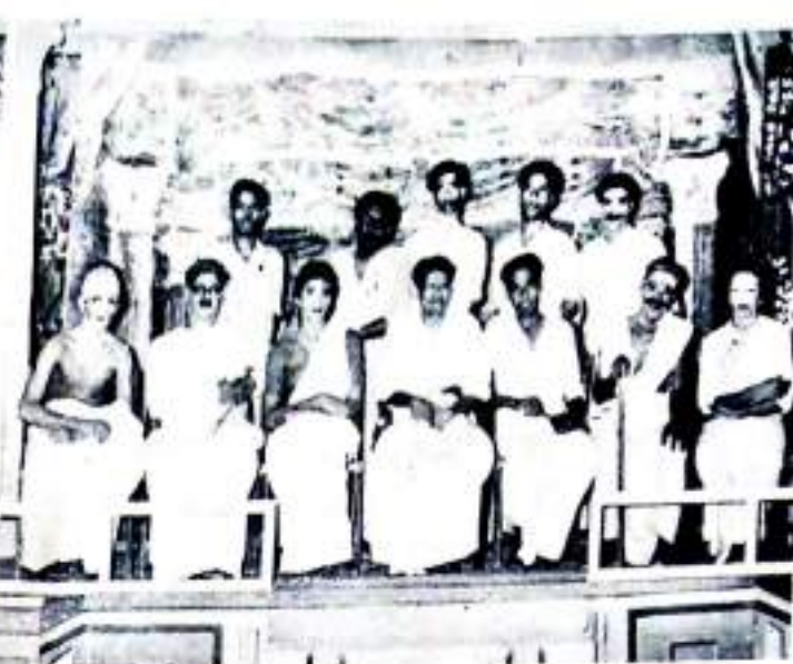
'മെട്രോപൊളിറ്റൻ', Drama staged on the Independence Day