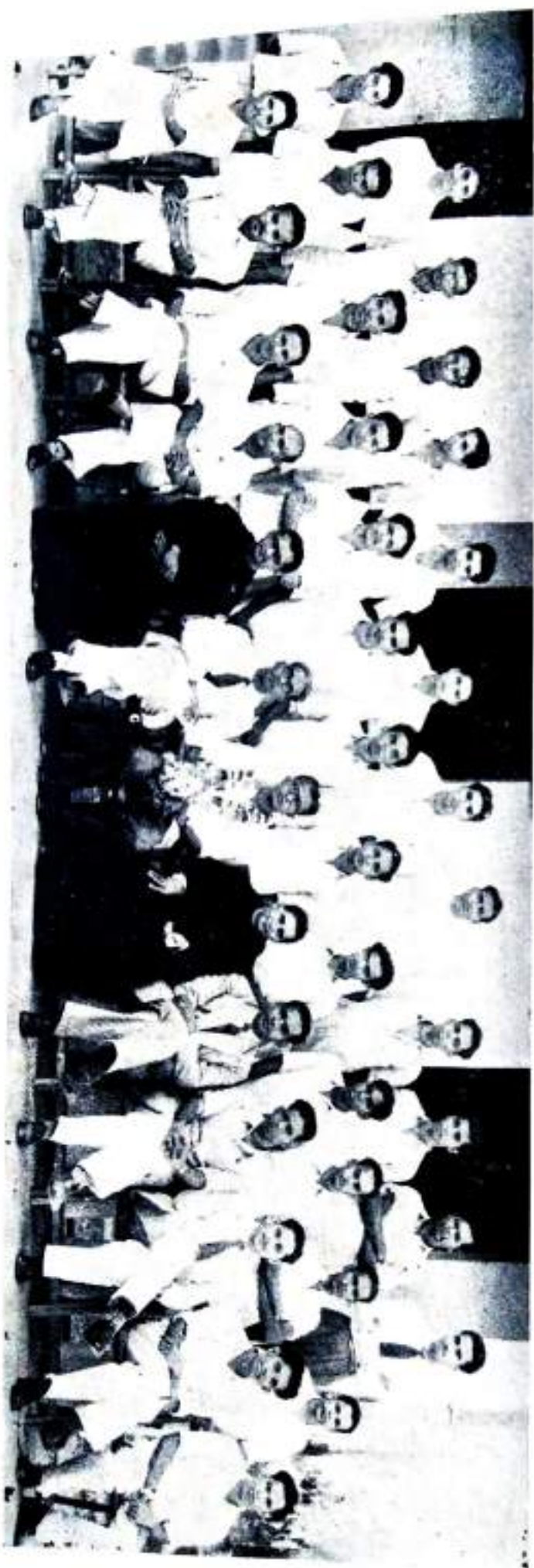
Out-going Students, B. Sc. Zoology.