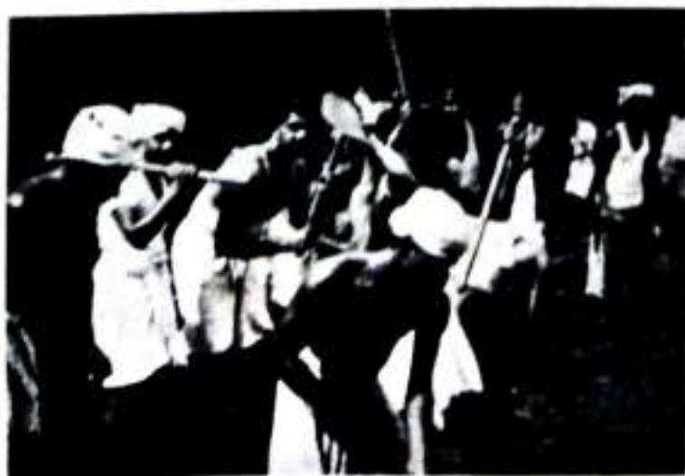
Work in Progress.