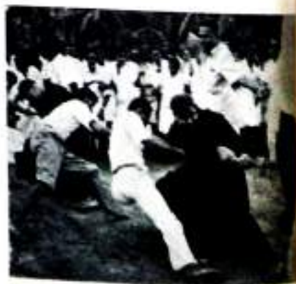
Arts Vs Science.