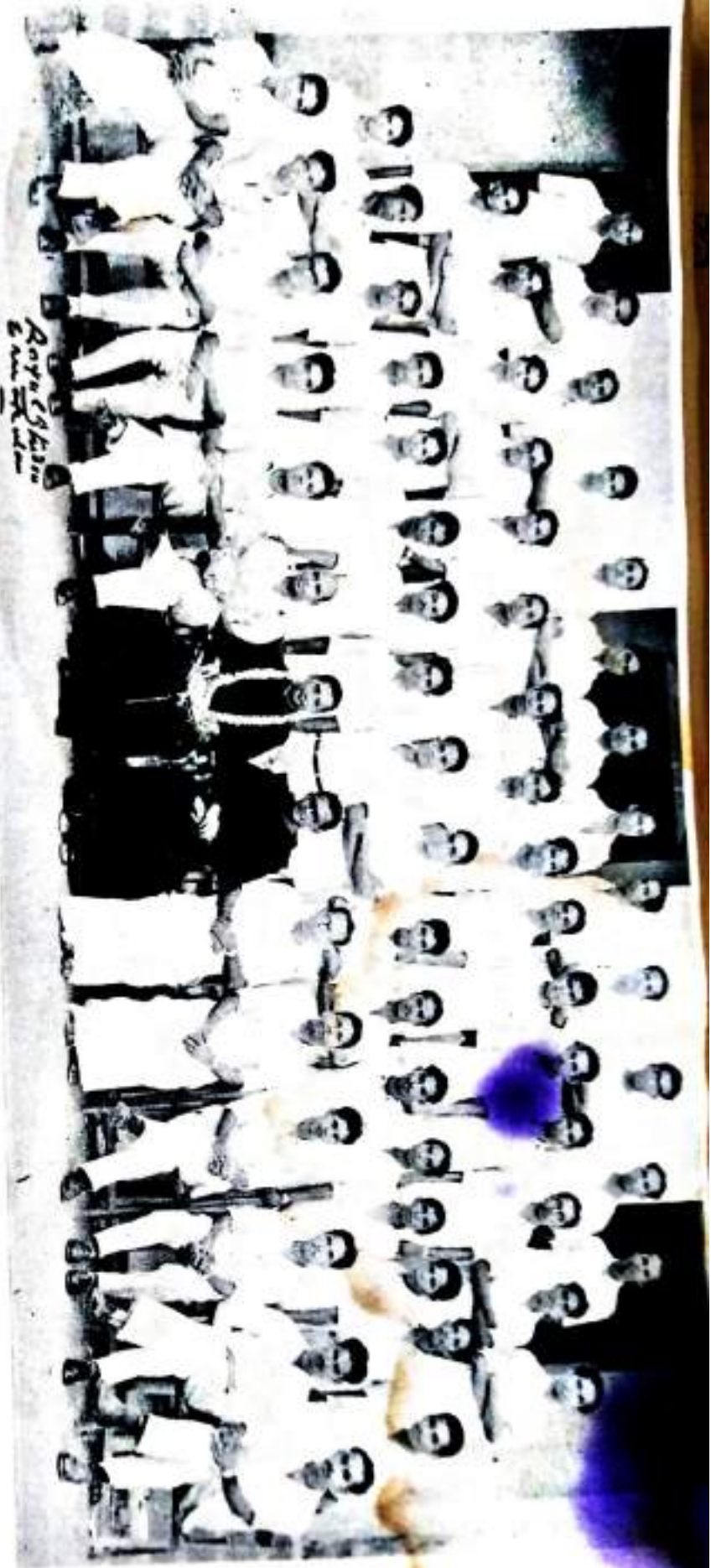
Boys' School Bachchan