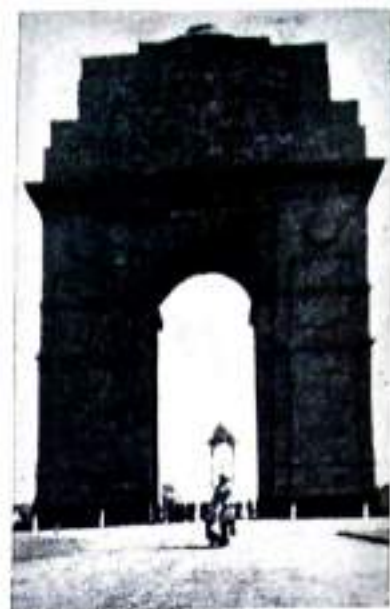
India Gate - War Memorial.