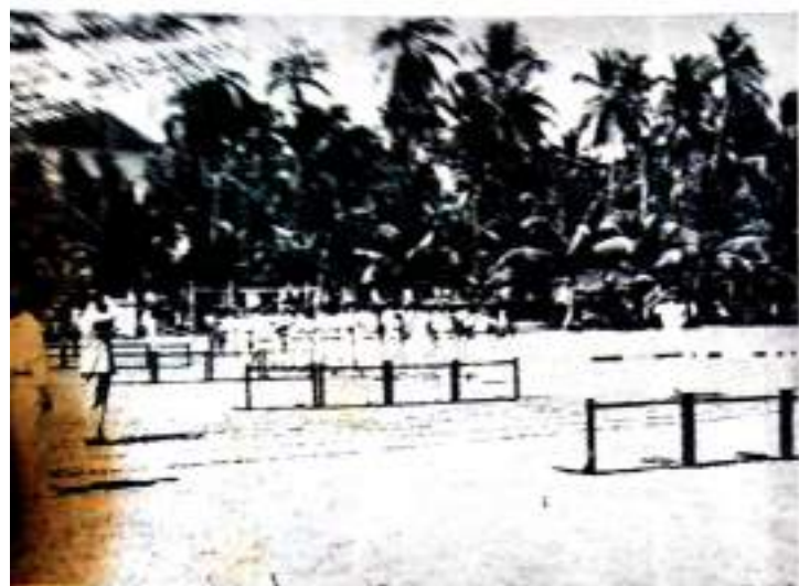
The Guest of Honour takes the salute.