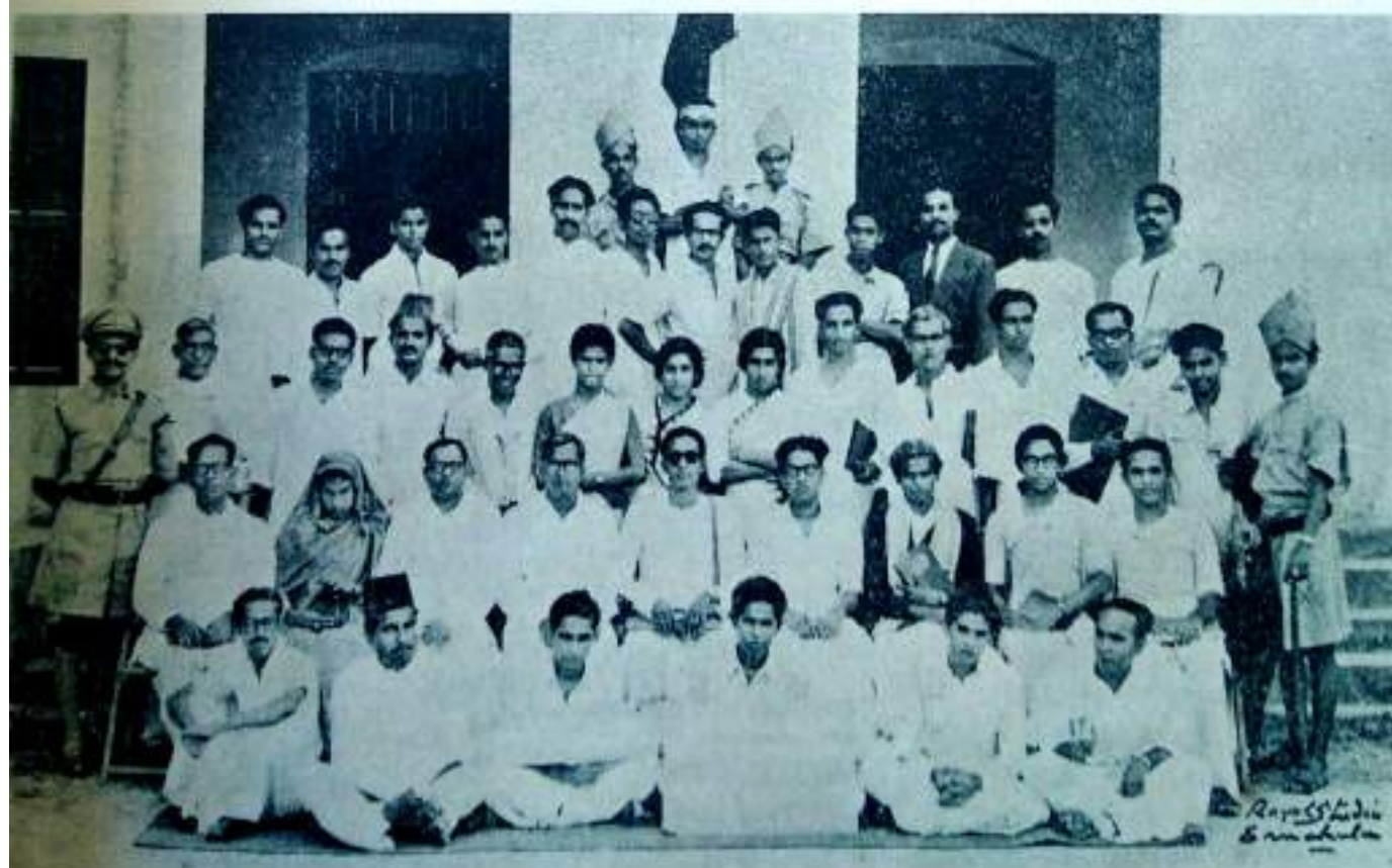
Mock Session of the Kerala State Assembly.