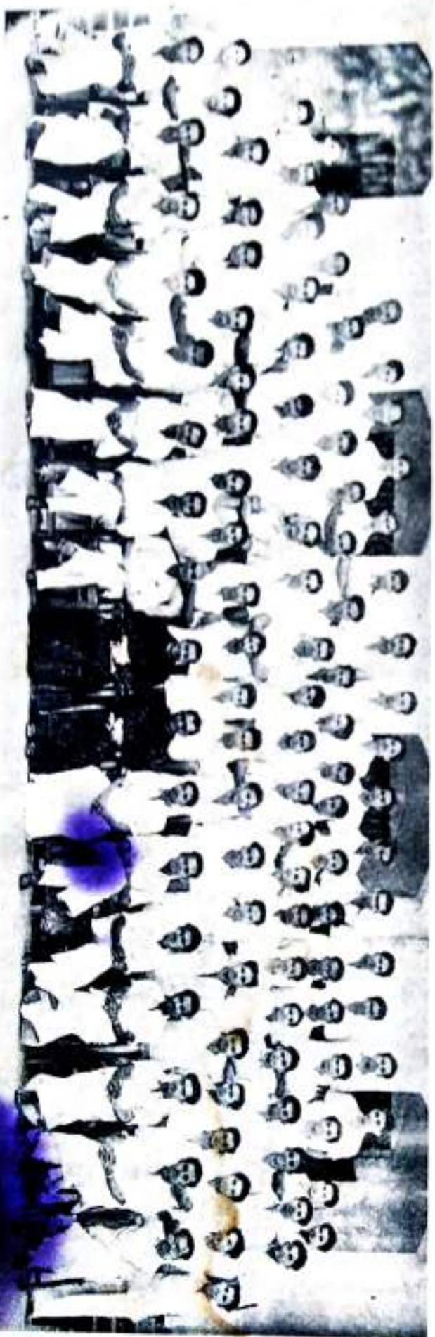
SOCIAL SERVICE LEAGUE