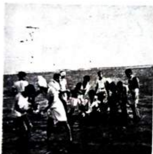
Search for Specimens.