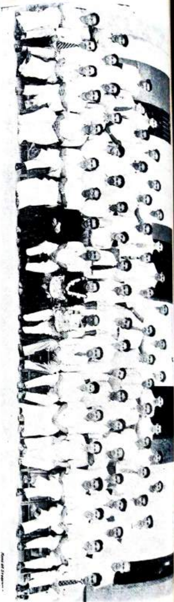
Out-going Students, B. Sc. Physics—First Batch.