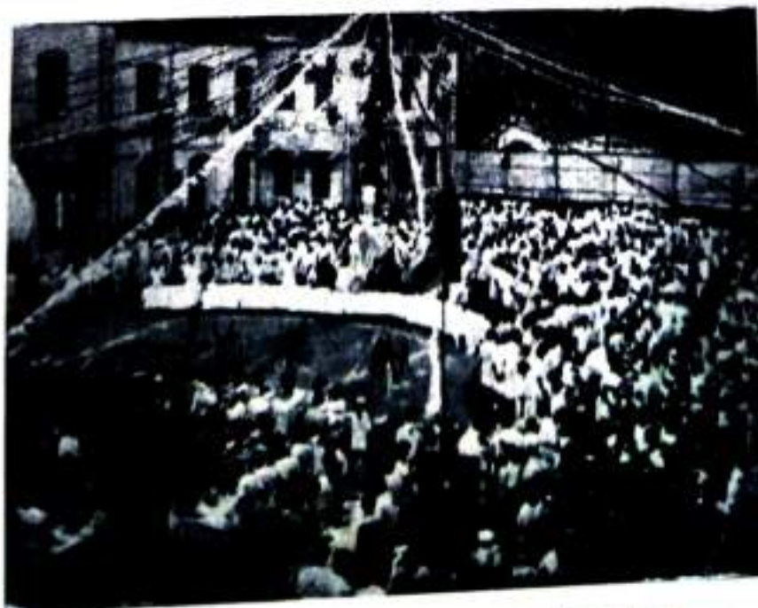
THE FEAST IS SET, THE GUESTS ARE MET.