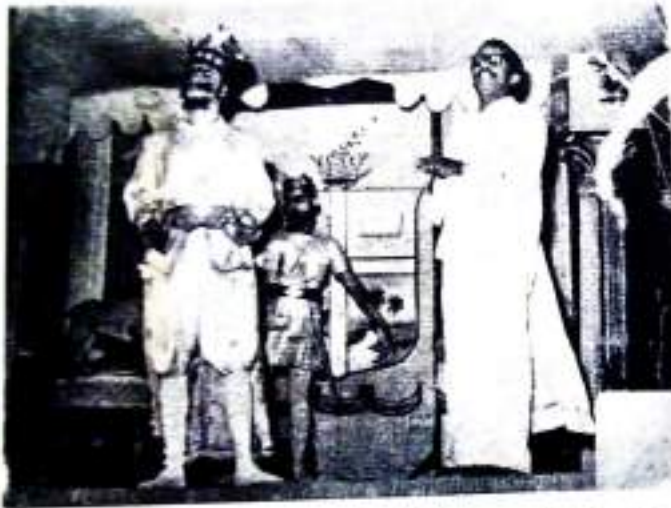
ചാരിട്ടനാടകം—By K. I. Mathew & Party